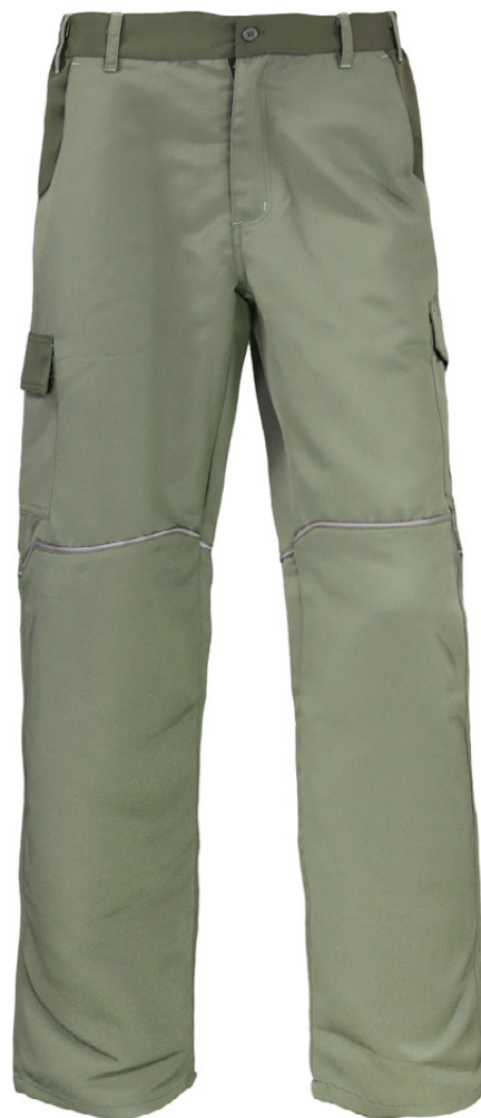
TABLA DE TALLAS (CM)

Cal-tex SpA. CERTIFICACIÓN DE CALIDAD TEXTILES, CUEROS Y CALZADOS