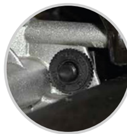
BREAKER DE SEGURIDAD