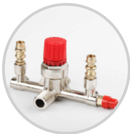
DOBLE SALIDA DE AIRE